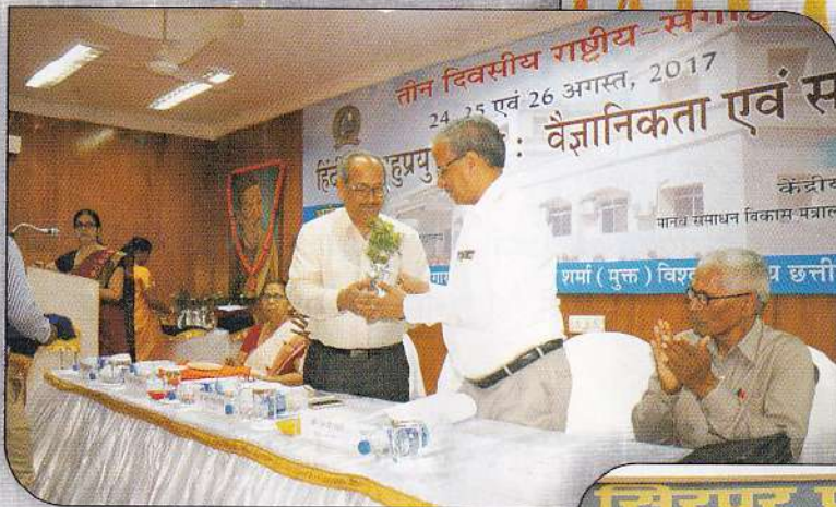
हिंदी के बहुप्रयुक्त रूप : वैज्ञानिक एवं संभावनाएँ तीन दिवसीय राष्ट्रीय संगोष्ठी