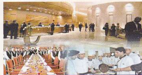
पाठ्य-सामग्री केवल ऑनलाइन-भाषा में उपलब्ध