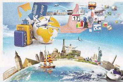
पाठ्य-सामग्री केवल ऑनलाइन-भाषा में उपलब्ध