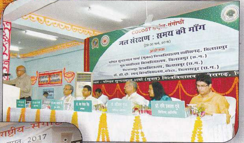
जल संरक्षण : समय की माँग दो दिवसीय राष्ट्रीय संगोष्ठी