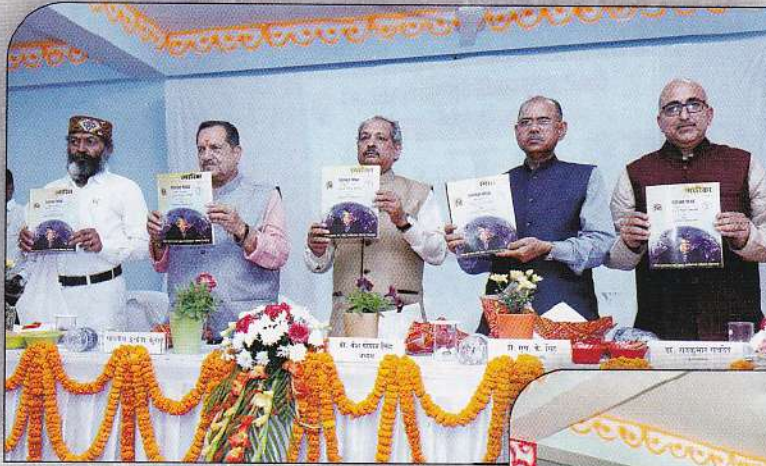
शाश्वत भारत तीन दिवसीय राष्ट्रीय संगोष्ठी