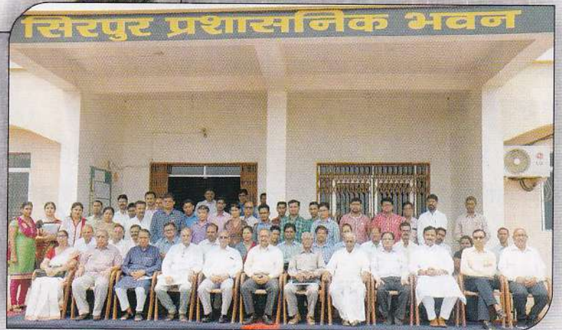
विश्वविद्यालयीन सेमीनार स्मृति